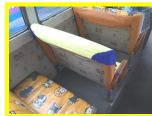
《ハーフカバータイプ》